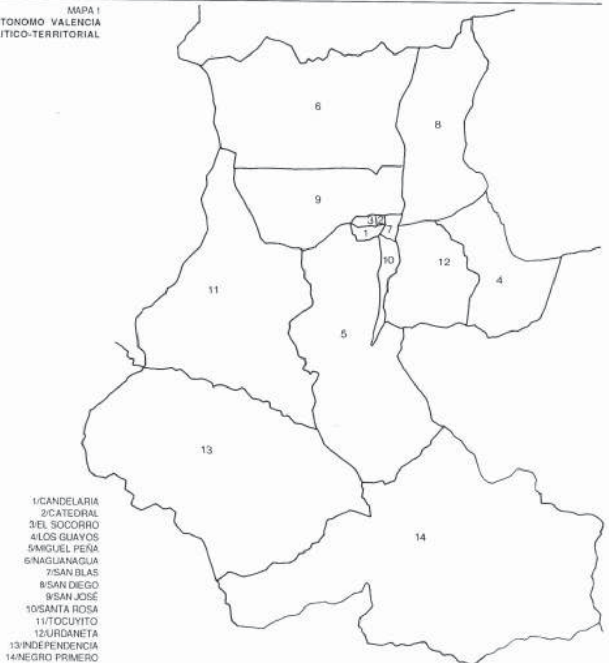
MAPA I MUNICIPIO AUTONOMO VALENCIA DIVISION POLITICO-TERRITORIAL