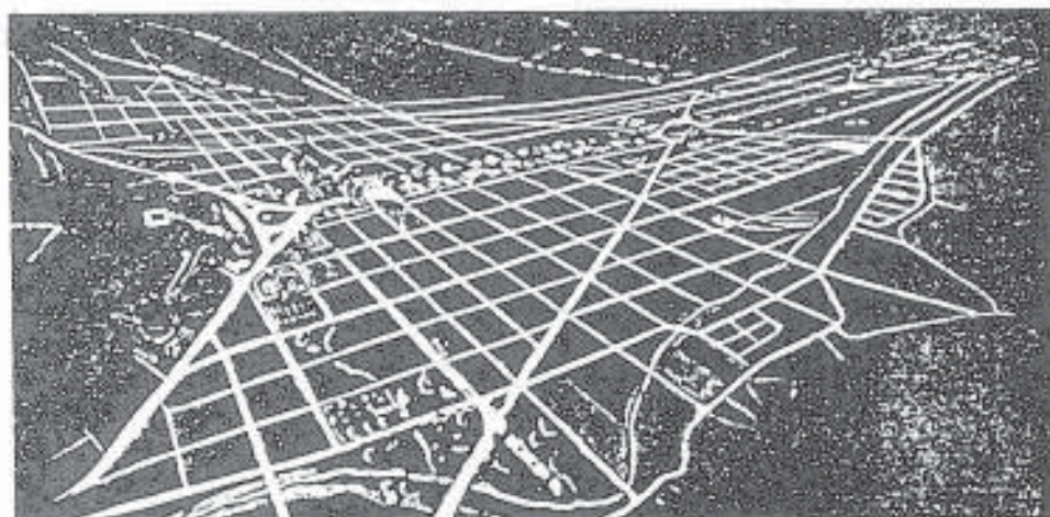
EL PLAN MONUMENTAL, 1939.

Entre los años de 1938 y 1939, al crearse la Dirección de Urbanismo del Distrito Federal, se contrata a los urbanistas Prost, Lambert, Rotival y Wegenstein, para que preparen un Plan Rector de Caracas, oficialmente llamado Plan Monumental