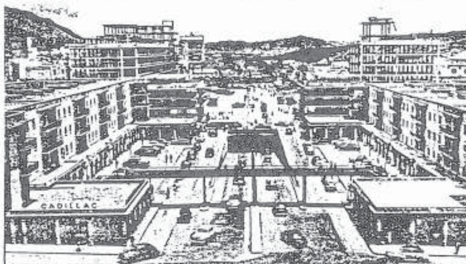
LA AVENIDA BOLIVAR, 1951.